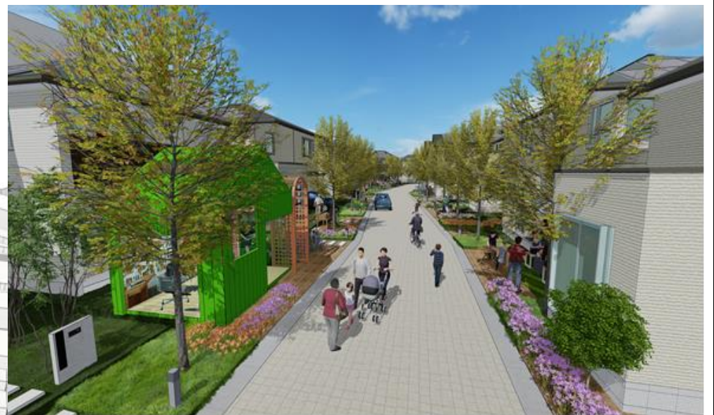
◆ シェアストリートのイメージ